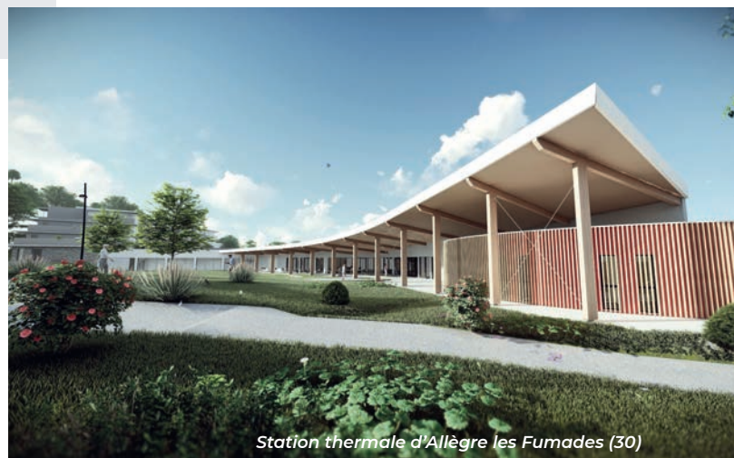
Station thermale d'Allègre les Fumades (30)