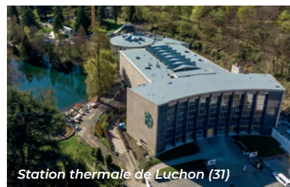
Station thermale de Luchon (31)