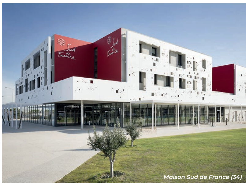
Maison Sud de France (34)