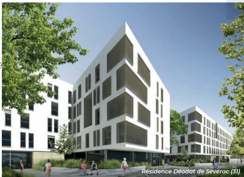
Résidence Déodat de Séverac (31)

Par le biais de montages mixtes ou privés, l'ARAC, acteur du développement économique régional, est à même d'étudier, concevoir, réaliser, porter et gérer des projets immobiliers, en mobilisant des capacités d'investissement et du savoir-faire dédié.